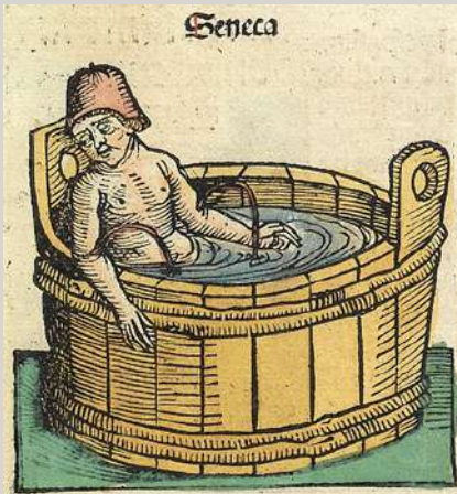
Visión del suicidio de Séneca. Nuremberg, Liber Cronicarum

( Cartas , 26.10). Séneca sabe que la libertad se adquiere a la vez que se abandona el temor a la muerte. Lo que distingue al amo del siervo es el miedo a la muerte (repetirá como un eco Hegel). Pero la decisión de morir no debe tomarse a la ligera. El hombre valeroso y sabio no debe huir de la vida a la carrera y atropelladamente, sino más bien salir de ella despacio y con elegancia. Hay en algunos algo así como un gusto de la muerte ( libido moriendi ) que invade tanto al valiente, que hace alarde de despreciar la vida, como al cobarde, que la teme. En esto de la muerte anticipada también hay que precaverse del puro hastío que, alentado a veces por la propia filosofía, nos mueve a decirnos: «¿Hasta cuando las mismas cosas?» y a acabar para siempre. El tedio hace que algunos aspirantes a suicidas no consideren la vida amarga y mala, sino meramente superflua y prescindible ( Cartas , 24.24-25). Pero a veces es necesario no ser remilgado ( delicatus ), aguantar en la vida, aun entre tormentos, por amor a los suyos. El hombre bueno ha de pensar en la esposa o los amigos, cuyo amor lo hará reconciliarse valerosamente con la vida ( Cartas , 104.3-4).