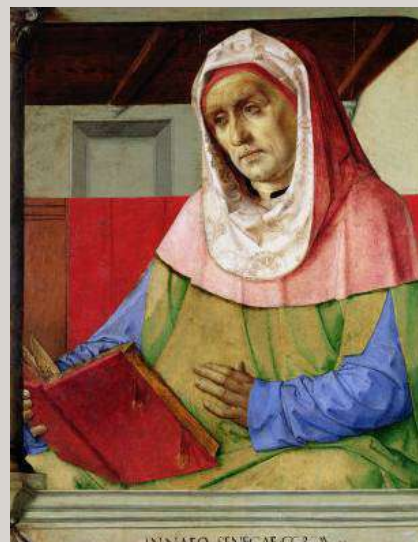
Retrato de Séneca (1475 ca.), Joos van Gent, Museo del Louvre, París

Nunca es el alma más divina –nos enseña– que cuando conoce su mortalidad y comprende que el cuerpo es una morada provisional e incómoda donde residimos como quien vive en casa ajena ( Cartas , 120.15-16). El alma despliega el propio pensamiento hacia lo infinito, no reconoce límites de espacio o tiempo, si no son esas fronteras que la separan de la divinidad y que comparte con ella. La muerte desagrega