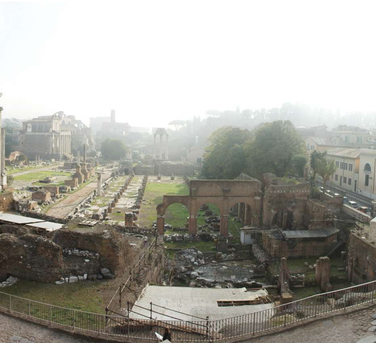
Antiguo Foro de Roma. © José Ramón Polo López