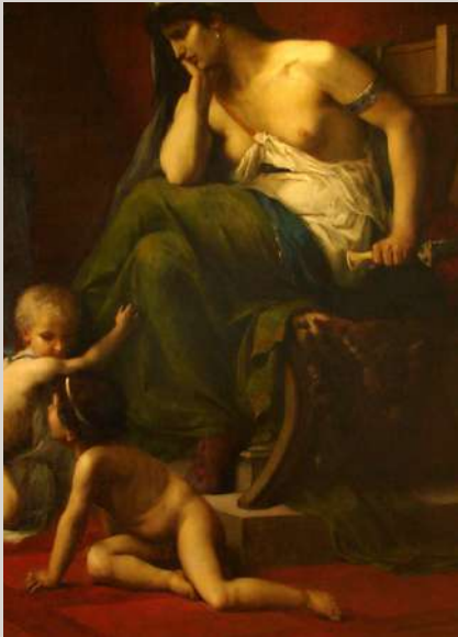
Medea, tema de una de las tragedias de Séneca. Medea (1868) por Henri Klugmann (1842-1871), Musée des Beaux-Arts de Nancy