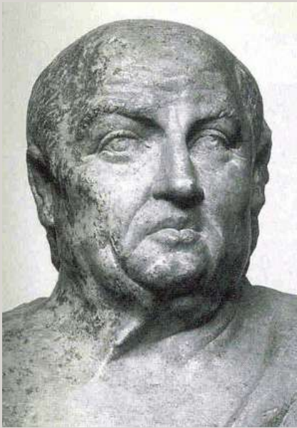
Vista frontal de busto de Séneca. Berlín Staatliches Museum, Antikensammlung.

para componer excelente poesía (un conjunto de tragedias imitadas de los clásicos atenienses) y redactar tratados filosóficos (algunos de ellos llamados Diálogos en recuerdo de Platón, aunque en puridad no son más que disertaciones muy vivas y cercanas a veces a la charla). Su obra más actual y entretenida es sin duda la colección de cartas dirigidas a su joven amigo Lucilio, que constituyen un precedente del ensayo moderno y -en ciertos pasajes- del artículo periodístico. Un género peculiar que cultivó es el de los escritos consolatorios (especie de carta de pésame), que nos documentan sobre sus lances biográficos y sus actitudes íntimas. Desde el destierro dirigió estas Consolaciones a su madre Helvia (para aliviar sus añoranzas) y a Polibio, el poderoso valido de Claudio (para suplicarle de paso perdón).