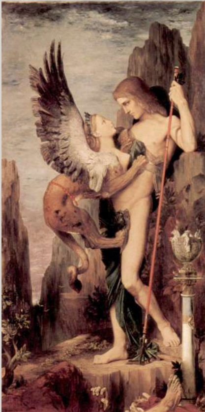
Edipo hablando con la esfinge (1864), por Gustave Moreau. Museo Metropolitano de Nueva York. Edipo es tema de una de tragedia escrita por Séneca.

Incluso un ocio digno puede estar lleno de tareas vanas. Con las cuestiones eruditas, como el averiguar si la Ilíada se compuso antes que la Odisea , o si eran obra de un mismo autor, «uno no logra pasar por más sabio sino por más cargante» (13.2). «Muy corta y abrupta es la vida de quienes olvidan el pasado, descuidan el presente y temen el futuro. Cuando lleguen al final, entenderán, pobrecitos, que estuvieron muy ocupados en no hacer nada» (16.1). No es lo mismo vivir mucho que sentir que los días se hacen inacabables. El sabio vive la verdadera vida tranquila y se hurta a la muerte. Mediante la memoria recobra el pasado, que deja de ser así tiempo perdido, y en su corazón anticipa las alegrías del porvenir. En las palabras finales, Séneca aconseja a Paulino dejar el cargo de intendente de abastos (a ratione), retirarse a la vida privada y dedicarse a asuntos más elevados, porque «es mejor conocer las cuentas de la propia vida que las del suministro público de trigo» (18.3). Aquí Séneca, aconsejando