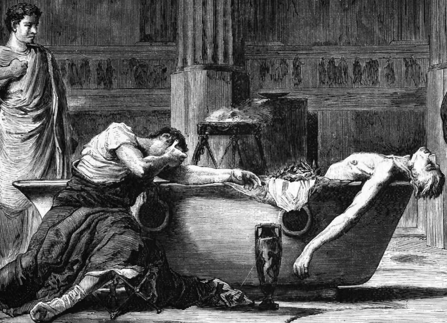
La muerte de Séneca (cuadro de Manuel Domínguez y Sánchez). Grabado sobre madera. La Ilustración Española y Americana , año XV, nº 33, noviembre 1871 (detalle).