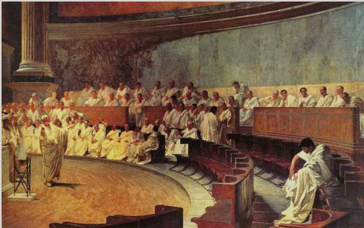
Cicerón denuncia a Catilina , por Cesare Maccari (1840-1919). Cicerón es una de las figuras propuestas como ejemplo por Séneca en Sobre la brevedad de la vida .

a un amigo apartarse de la vida pública. Como es sabido, los estoicos aconsejaban participar en política, mientras que Epicuro aconsejó vivamente lo contrario. Séneca, movido por cierto desengaño de la vida pública y la administración, se convierte aquí -como tantas veces a lo largo de sus Cartas -, en un epicúreo circunstancial.